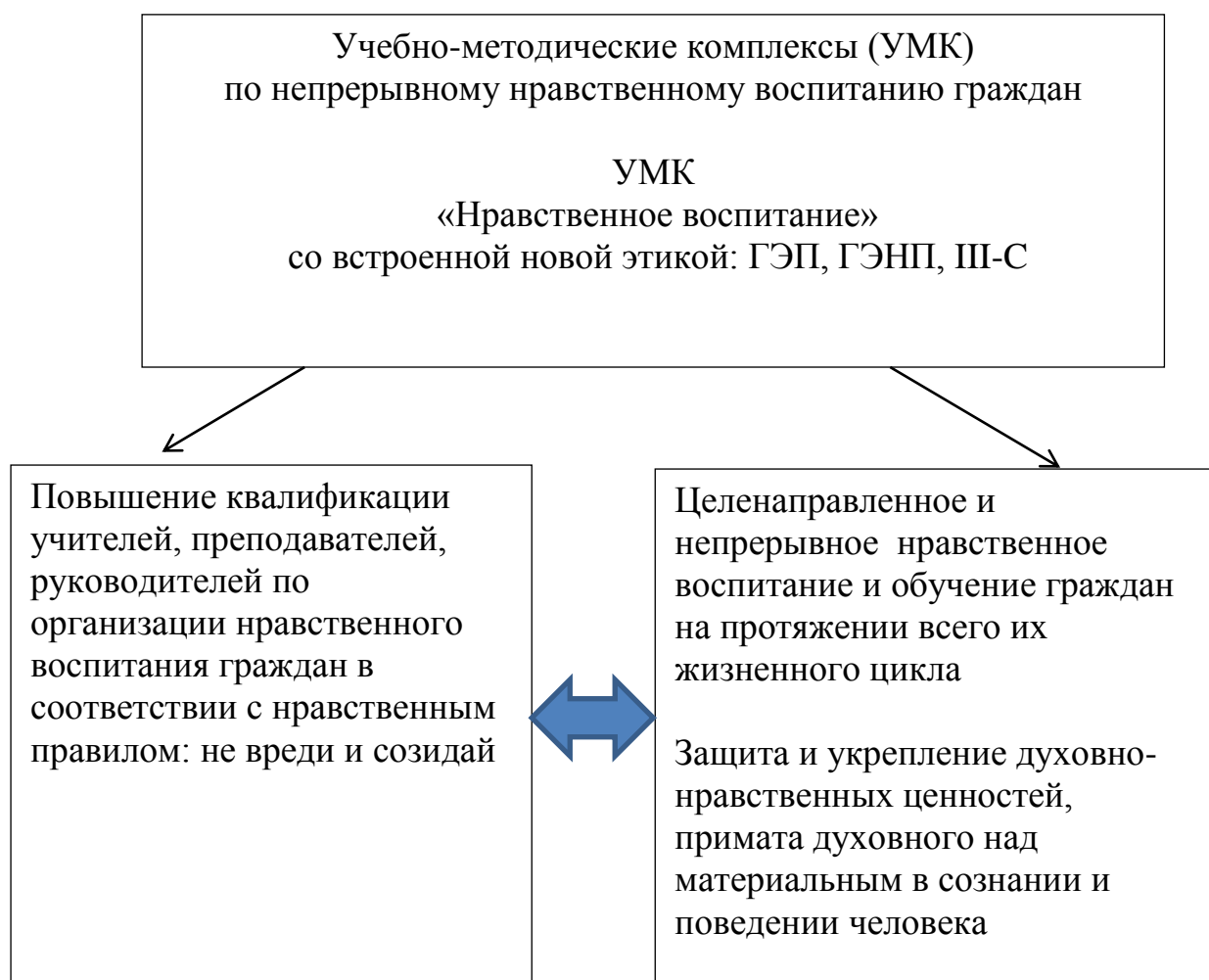
Рис. 2. Функция нравственного воспитания граждан, обеспечивающего формирование нравственного гражданина

организаций, исключаящие причинение вреда гражданам и среде их обитания.